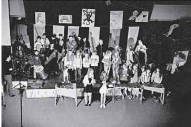
Lehrer und Schüler der Realschule am Giersberg gemeinsam auf der Bühne

Zum zweiten Mal präsentiert die Realschule am Giersberg am 6. April ab 18.30 Uhr einen Kulturabend – dieses Jahr unter dem Motto „Frühlingsfeuerwerk“. Die Klasse 8b sorgt für das Rahmenprogramm und ab 19.30 Uhr zündet dann ein musikalisches, theatralisches, zirkussisches und tänzerisches Feuerwerk auf der Bühne im Foyer des Schulzentrums Dreisamtal. Alle Eltern, Freunde und interessierte Bürgerinnen und Bürger sind herzlich eingeladen!