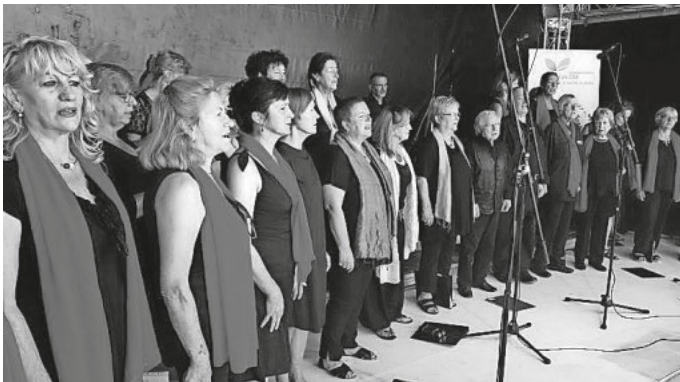
Auch bei der Landesgartenschau in Lahr hatte der Gospelchor einen Auftritt