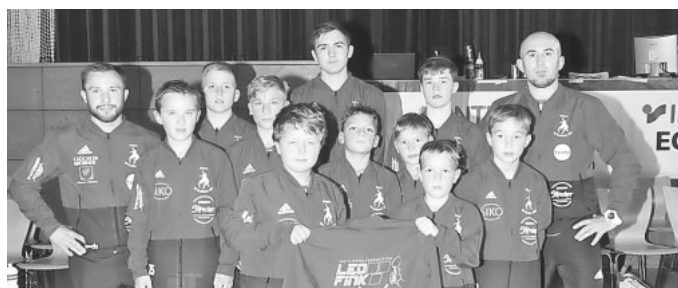
Foto: Unsere Jugendstaffel