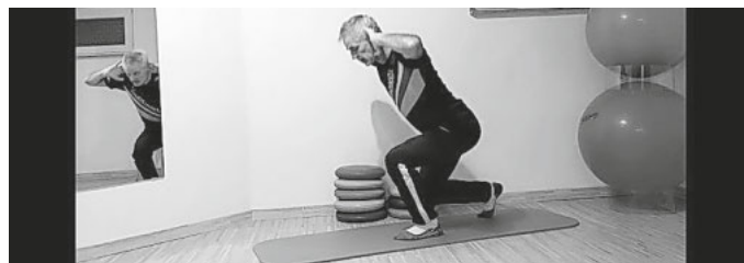
Bild 2: Der Bewegungsablauf entspricht der Übung 1, jedoch neigen wir uns beim Beugen mit geradem Rumpf nach vorne und richten uns wieder auf. Somit haben wir noch eine Beteiligung des langen Rückenstreckers.

Bild 1: Aus senkrechter Position bewegen wir uns auf und ab. Die Bewegung wird bei 90 Grad im vorderen Knie abgebremst. Dann drücken wir uns wieder nach oben.