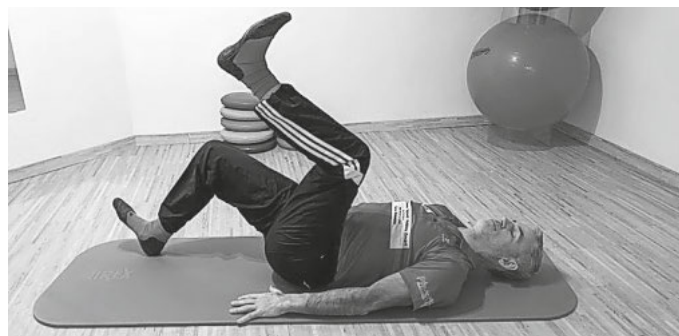
Bild 1: Aus der Rückenlage bringen wir unsere Beine zunächst in eine rechtwinklige Position, der Stufenlage. Dann berühren wir im Wechsel mit der Ferse die Unterlage.

Übung der Woche – Training der Bauchmuskulatur. Kaum ist der dritte Advent vergangen, stellen wir Ihnen als Übung der Woche den Teil 4 vor. Es geht um das Training der Bauchmuskulatur. Drei Schwierigkeitsgrade stehen zur Verfügung: