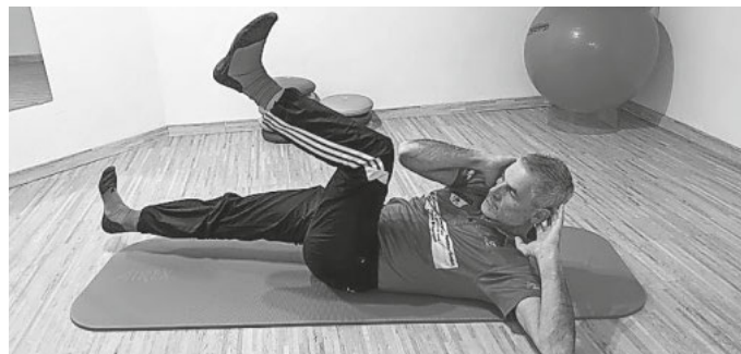
Bild 3: Aus der oben beschriebenen Ausgangsposition führen wir den Ellbogen zum diagonalen Knie, während sich das andere Bein streckt. Dies führen wir im fließenden Wechsel rechts-links durch. Zur Erreichung des optimalen Effekts und der entspr. Absicherung, sollte der untere Rücken während des gesamten Übungsablaufs in Kontakt zur Unterlage bleiben. Weitere Informationen können aus unserer Homepage, Sportverein-Eschbach1967, entnehmen.

Bild 2: Die Ausgangslage entspricht der Übung 1, jedoch verlängern wir den Beinhebel. Mit gestrecktem Bein berührt die Ferse im Wechsel die Unterlage.