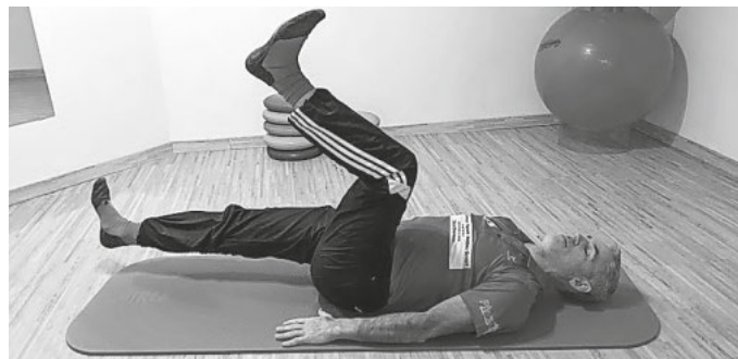
Bild 2: Die Ausgangslage entspricht der Übung 1, jedoch verlängern wir den Beinhebel. Mit gestrecktem Bein berührt die Ferse im Wechsel die Unterlage.

Bild 1: Aus der Rückenlage bringen wir unsere Beine zunächst in eine rechtwinklige Position, der Stufenlage. Dann berühren wir im Wechsel mit der Ferse die Unterlage.