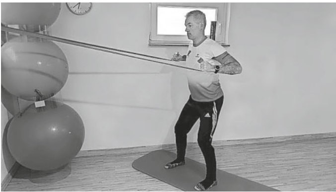
Bild 3: Bei dieser Variante stehen wir parallel. Der Körper ist ausstabilisiert. Wir ziehen das Band in die Ellbogenbeugung (Rudern)

Alle vorangegangenen Übungen können auf der Homepage der Gemeinde Stegen/ Archiv/Mitteilungsblatt ersehen werden. Weitere Workout Videos sind auf unserer Homepage, Sportverein-Eschbach1967, zu sehen.