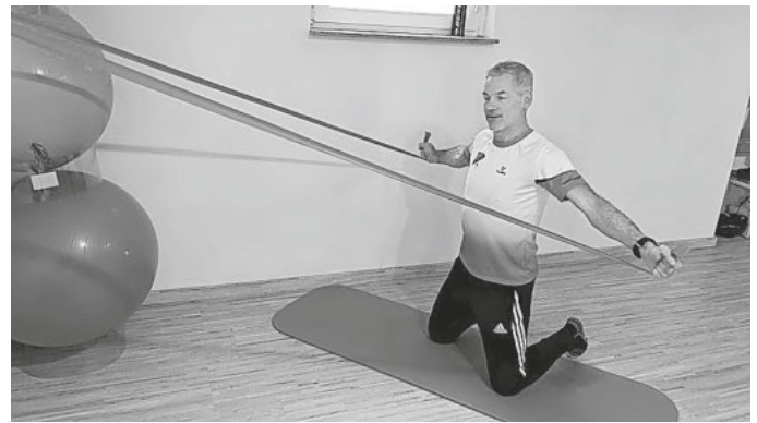
Bild 4 : Wir wechseln die Ausgangsstellung in den Kniestand (Knie weich unterlagern). Jetzt das Gummiband am langen Arm, auf Schulterhöhe nach außen ziehen.

Wichtig ist, während der Übungen die Bauchmuskeln angespannt zu halten. Führen Sie jede Übungsvariante 20 mal durch. Viel Spaß beim üben !