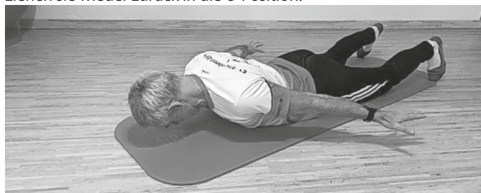
Bild 4: Die Arme seitlich am Körper, leicht abgespreizt. Aus dieser Position jetzt ein Bein im Wechsel leicht anheben. Führen Sie jede Variante mindestens 15 mal durch, mit einer Pause von 30 Sekunden. Denken Sie daran, die Bauchmuskeln anzuspannen. Viel Spaß beim üben !

Weitere Workout Videos können Sie aus unserer Homepage, Sportverein-Eschbach1967, ersehen.