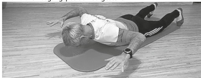
Bild 2: Wir heben die Arme parallel zur Bodenebene und senken sie wieder ab.