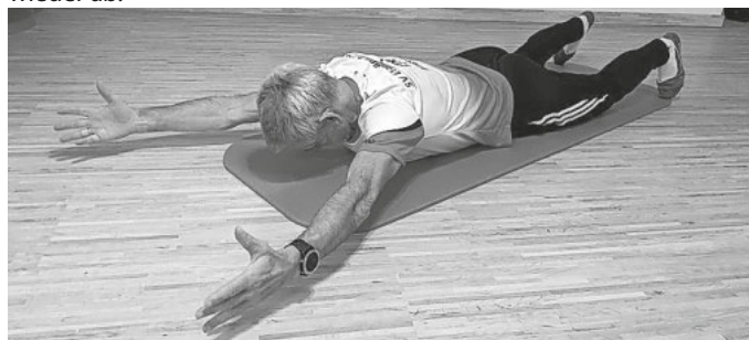
Bild 3: Mit angehobenen Armen, strecken wir diese nach vorn und ziehen sie wieder zurück in die U-Position.