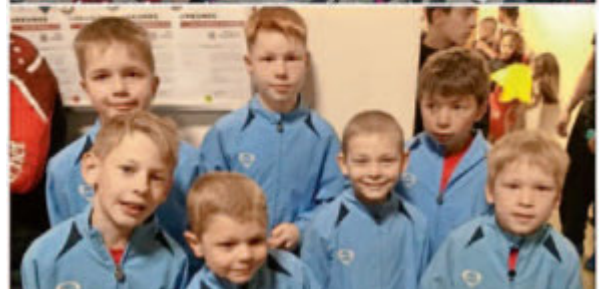
Fotos: 19 Eschbacher Jugendringer/innen zeigten über zwei Tage ihr Können beim Hornberger Turnier