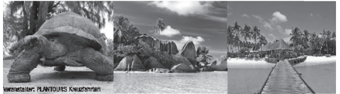
Veranstalter: PLANTOURS Kreuzfahrten

Bordguthaben € 50,- pro Person Kombi-Ersparnis mit der Anschlusskreuzfahrt Madagaskar & Mauritius sparen Sie € 1.300,-