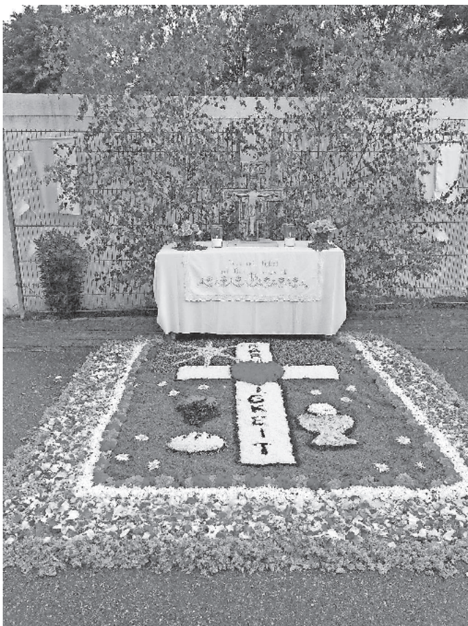
Patrozinium am 05.06.2016