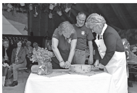
Anschnitt des „Stegerer Milchtagekäses“ auf dem Scherpeterhof