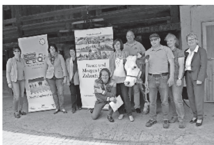
Treffen auf dem Hinterbauernhof bei Familie Rombach