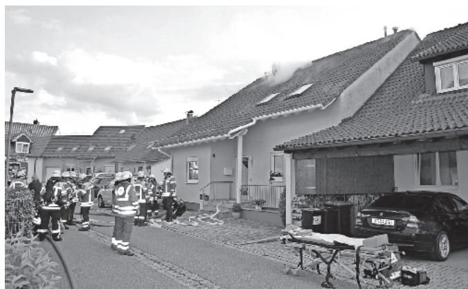
Das Brandobjekt mit dem Rauch im Dachbereich und die Versorgung der Verletzten.

Eine anspruchsvolle Übung galt es für die Gesamtwehr Stegen und das Rote Kreuz der Dreisamalgemeinde im Stockacker bei der Frühjahrsübung zu bewältigen. Im Dachstuhl eines Reihenhauses war ein Feuer ausgebrochen und zunächst galt es für die Feuerwehr die Verletzten aus dem deutlich sichtbar verrauchten Gebäude zu evakuieren und an das Rote Kreuz Stegen zur Versorgung zu übergeben. Dies gelang auch zügig und insgesamt wurden dann von den ehrenamtlichen Helfern des Roten Kreuzes vier Patienten mit unterschiedlichen Verletzungsmustern betreut. Die Feuerwehr konnte sich dann um die Belüftung des Gebäudes kümmern und hatte schon zuvor mit der Löschwasserversorgung begonnen um das Gebäude möglichst vor weiterem Schaden zu schützen. Ebenfalls überprüft wurde das direkt angrenzende Nachbarhaus auf mögliche Schäden, was aber nicht geschah. Durch die dichte Bebauung in diesem Bereich der Gemeinde war es für alle Beteiligten keine leichte Übung, weil es galt die umliegenden Gebäude auch vor Schaden zu bewahren.