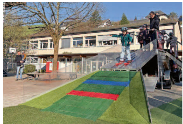
Mobile Skisprungszchanze Grundschule Stegen-Eschbach (Text siehe innenliegend!)

Am Mittwoch, den 02. April, durfte sich die Grundschule Stegen-Eschbach über einen besonderen sportlichen Besuch freuen: Die Familie Rießle war im Namen der „Running Dragons“ mit ihrer mobilen Skisprungszchanze zu Gast und sorgte für große Begeisterung bei Kindern und Lehrkräften.